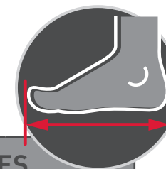
TABLEAU DES TAILLES